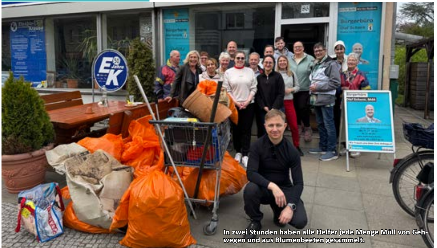
In zwei Stunden haben alle Helfer jede Menge Müll von Gehwegen und aus Blumenbeeten gesammelt.